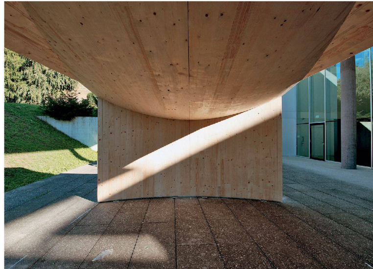
Der gekrümmte Pavillon aus Holz in Mendrisio trägt ohne Metallverbindungen.