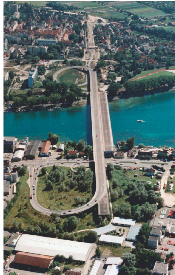
Fast 20 Jahre lang war die Brücke nur zur Hälfte benutzbar.

Halt, eins hat das Ganze schlussendlich doch gebracht – aber war das wirklich so geplant? Die Schweizer A7 beschert Konstanz einen kaum noch zu bewältigenden Ansturm konsumwilliger Eidgenossen, die hinterher an den Zollämtern brav Schlange stehen und sich ihre Mehrwertsteuerrückerstattungsstempel abholen. Die UFO-Brücke heisst auf Schweizerdeutsch «Aldi-Brugg» – an ihrem nördlichen Ende liegt das Eldorado, die grenznächste Filiale des Discounters. Den Konstanzer Einzelhandel freut's, die Bürger – nun ja. •