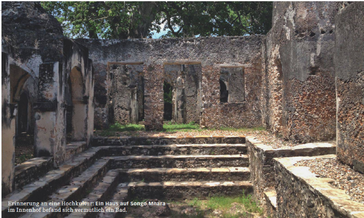
Erinnerung an eine Hochkultur: Ein Haus auf Songo Mnara – im Innenhof befand sich vermutlich ein Bad.

Vielleicht den Bogen weiter spannen und weltbekannte Beispiele bringen (Goldgräber Johannesburg), dass das ein dauernd und überall wiederkehrendes Phänomen ist. (ne)