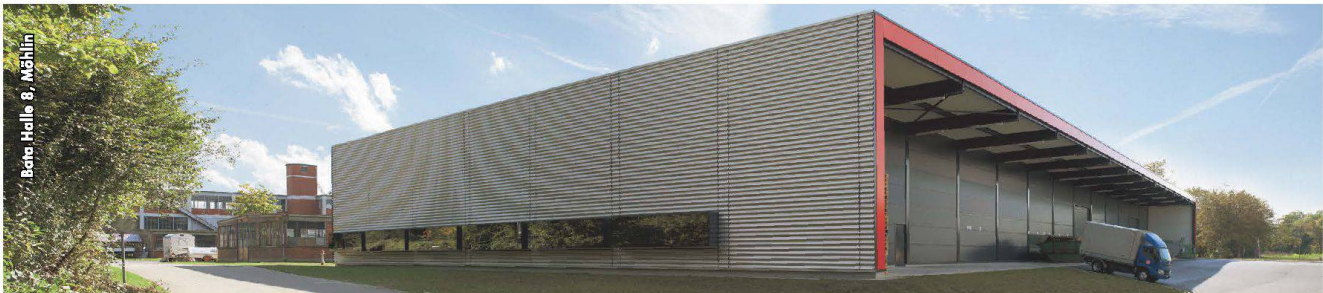
Betre, Halle 8, Möhlin

JAKEM AG Industrie Breitenloh 2 CH-4333 Münchwilen