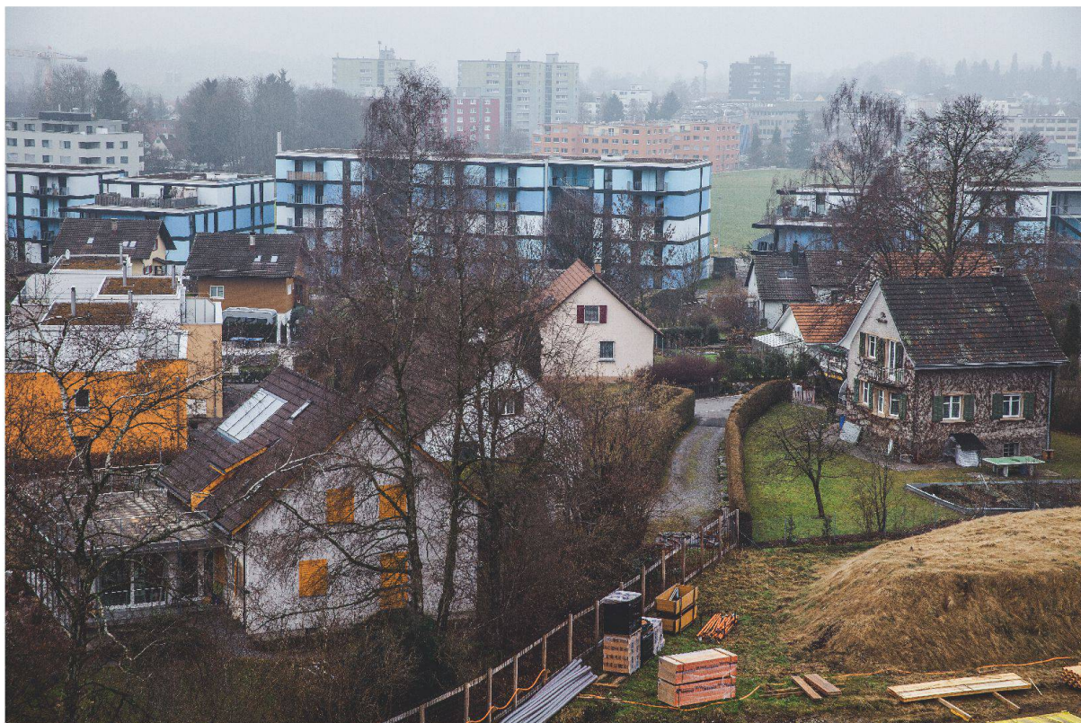
In Wetzikon stehen die unterschiedlichsten Bebauungsstrukturen, Baustile und Nutzungen nebeneinander.

Vor wenigen Jahrzehnten noch waren für das Ortsbild von Wetzikon die fünf alten Dorfkerne bestimmend. Heute sind vor allem diejenigen Quartiere von Wetzikon prägend, die zwischen den ehemaligen Kernen entstanden sind. Zwischenräume in den Siedlungsstrukturen wurden mit Neubauten aller Art aufgefüllt – gleichzeitig blieben jedoch ältere Gebäude stehen. Diese bauliche Heterogenität widerspiegelt die Konflikte und Veränderungen innerhalb der lokalen Akteurskonstellationen.