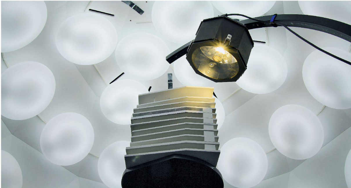
Das Modell unter dem Tageslichtdom. Der Aufbaustrahler simuliert den direkten Sonneneinfall.

Die Halbkugel mit einem Durchmesser von 3.5 m hängt mitten im Grossraumbüro an der Decke. Es ist das Herzstück der Simulationsanlage des Zürcher Lichtplanungsbüros Reflexion: der Tageslichtdom. Er schafft das nötige Licht, um Tageslichtverhältnisse und Lichtwerte am physischen Modell unter realistischen Bedingungen ausmessen und bewerten zu können – als Ergänzung zur digitalen Simulation mit Softwares wie Relux oder Dialux. Ausser Reflexion betreibt in der Schweiz einzig die EPFL einen Tageslichtdom. 1