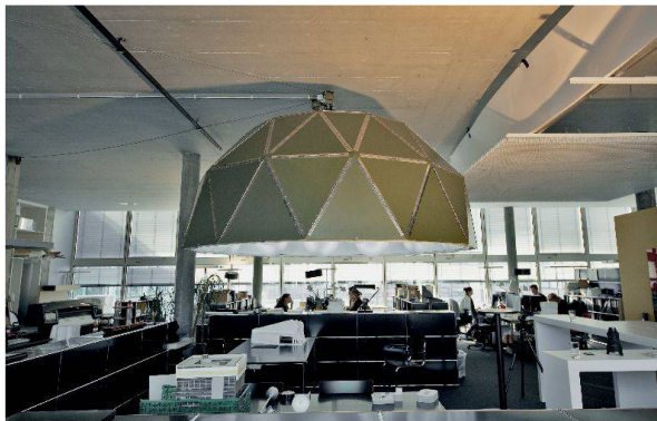
Der Tageslichtdom in der Räumlichkeiten von Reflexion.

5 Verhältnis der Beleuchtungsstärke im Raum zu derjenigen draussen bei bedecktem Himmel.