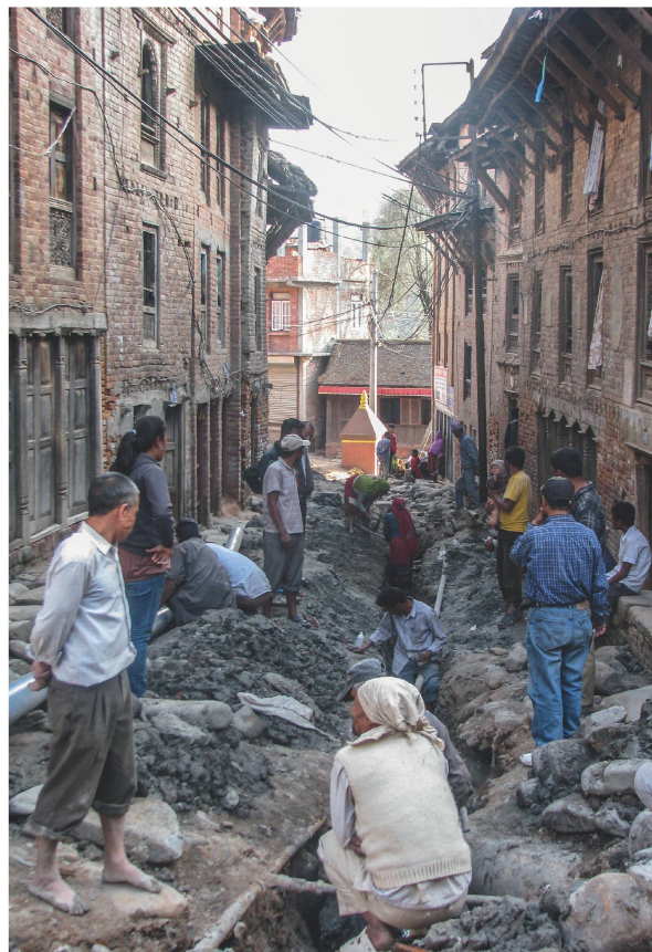
Bewohner der Stadt verlegen die simplifizierte Kanalisation, die zur dezentralen Kläranlage führt. Sie hat einen geringeren Rohrdurchmesser und transportiert nur Haushaltsabwässer und kein Meteorwasser.

Bewohner des Quartiers priorisierten die Probleme, sodass im nächsten Schritt in Experten- und öffentlichen Workshops mit Beteiligung von Sandec die beste technische Lösung gefunden werden konnte. Eine in Suaheli übersetzte Broschüre mit den verschiedenen technischen Alternativen für die Planung veranschaulichte die Möglichkeiten (vgl. Abb. links). Zudem unterstützten drei gebaute Pilot- und Demonstrationsanlagen mit unterschiedlicher Sanitärtechnologien die Bewohner bei der endgültigen Wahl.