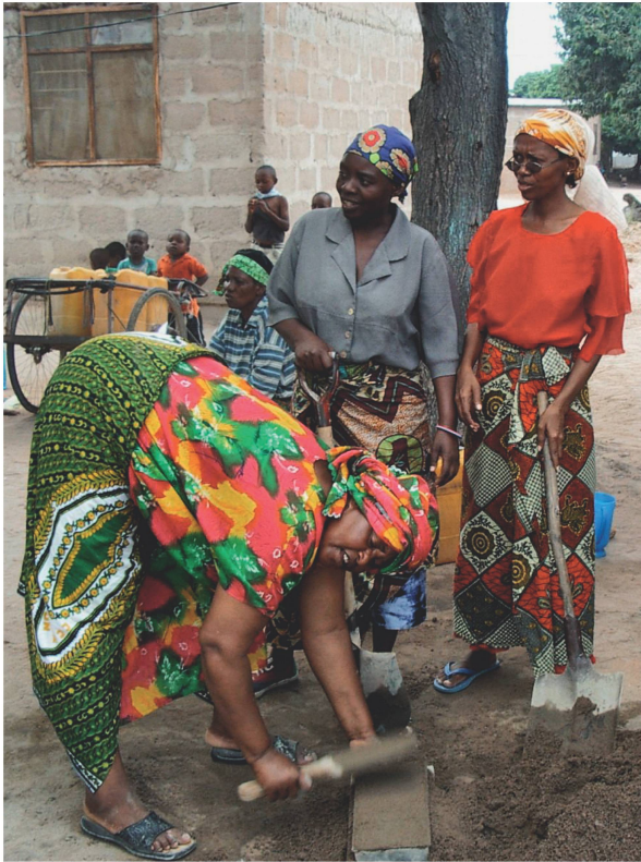
Frauen helfen bei der Anfertigung der Bausteine für die Toilettenhäuschen für den Stadtteil Chang'ombe in Tansania.