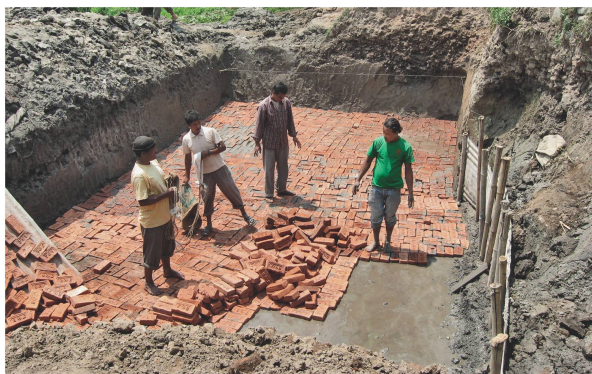
Der Boden der dezentralen Kläranlage besteht aus lokal hergestellten Backsteinen und wird danach mit Zement verputzt.