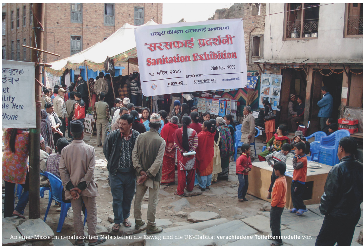
An einer Messe im nepalesischen Nala stellen die Eawag und die UN-Habitat verschiedene Toilettenmodelle vor.