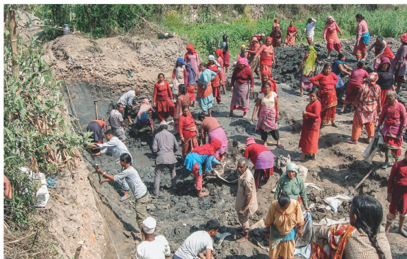
Frauen aus Nala helfen mit beim Bau der Anlage, indem sie die Baustelle vorbereiten. Gräser und Pflanzen werden entfernt.