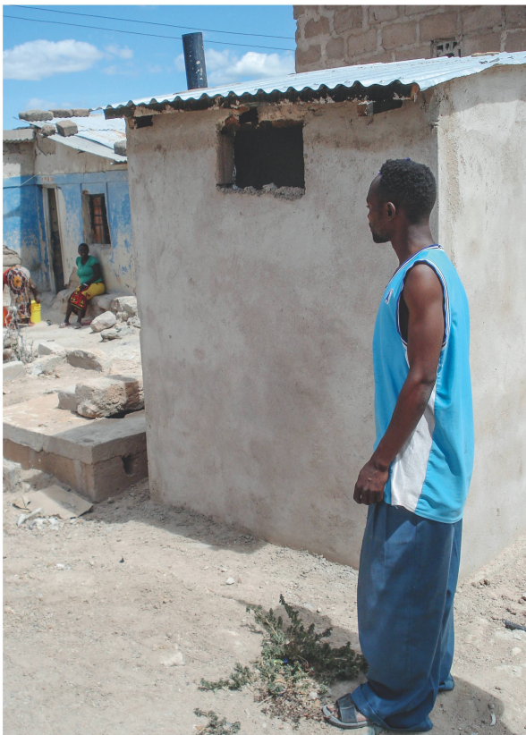
Tansania: Eines der neuen Toilettenhäuschen ist erstellt.

auch einkommensschwache Haushalte einzubeziehen, richtete eine lokale Kooperative ein Mikrofinanzierungsprogramm mit einer Laufzeit von 12 bis 24 Monaten ein. Ein Fonds und eine Anleitung für Wartung, Betrieb und Management der Infrastruktur gewährleisten die Nachhaltigkeit.