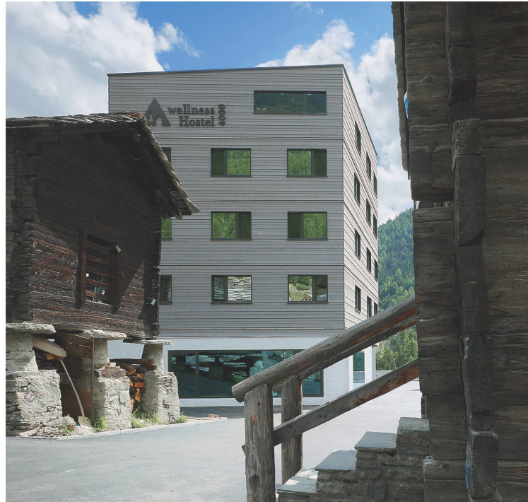
Zwei Arten Speicher: die historischen Stadel und die neue Herberge.

2009 spannten die Schweizer Jugendherbergen und die Burgergemeinde in einer Public Private Partnership zusammen und schrieben einen Studienauftrag für das Projekt aus. Der Standort war zwar durch das Hallenbad vorgegeben, aber dennoch ideal: neben der Postautostation und nur wenige Minuten von der Talstation der Bergbahnen entfernt, hoch über der 300 m tiefen Schlucht der Fee-Vispa. Realisieren durfte den Bau das Basler Architekturbüro Steinmann & Schmid.