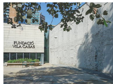
Museo Can Framis, Fundació Vila Casas , BAAS Arquitectos/Jordi Badia, 2007–2009.