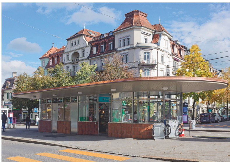
Das denkmalgeschützte Tramwartehäuschen besteht aus einer offenen Warte Halle auf der einen sowie aus einer Toilettenanlage und einem Kiosk auf der anderen Seite. Ein ausladendes Dach fasst die beiden Körper zusammen.