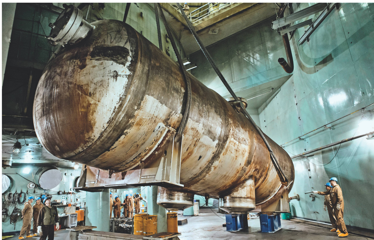
KKW Lubmin bei Greifswald: Dampferzeuger und Reaktordruckgefässe sind an Trocken- und Nasserlegeplätze gebracht worden.

Der Traum vom eigenen Reaktor begann auf einer grünen Wiese im unteren Aargauer Aaretal. Ab Mitte der 1950er-Jahre lotete ein Konsortium der damaligen Grossfirmen Brown Boveri & Cie, Gebrüder Sulzer sowie Escher, Wyss und Cie das industrielle Potenzial der zivilen Atomtechnologie aus. 1 Walter Boveri persönlich schloss den Kaufvertrag für die abgelegene Parzelle zwischen Aare und Wald ab; in der Folge entstand darauf das Reaktorzentrum Würenlingen (Schweizerische Bauzeitung, Jg. 76, H. 38), und heute ist dies das östliche Gelände des Paul-Scherrer-Instituts (PSI). Hier erforschen Physiker und Chemiker der ETH nun Materialien, Supraleiter und Photovoltaikzellen; vor 57 Jahren trat