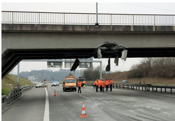
Im vergangenen Januar rammte ein zu hoch beladener Lastwagen die A1-Überführung bei Birmenstorf. Nun wird die beschädigte Brücke abgerissen.

Solche und ähnliche Fragen bewegten Walter Ammann vorerst im Lawinenschutz. Sein Ansatz war schon bald, dass man organisatorische statt baulicher Massnahmen stärker fördern sollte – wie etwa die zeitweilige Schliessung einer Strasse anstatt einer millionenschweren Galerie. Diese Ideen trafen jedoch zunächst auf grossen Widerstand. Das Umdenken kam mit dem Lawinenwinter 1999, auch von Seiten des Bundes. Das bestärkte Walter Ammann in der Idee, alle Naturgefahren nach einem einheitlichen System zu betrachten. 2006 organisierte er erstmals eine internationale Konferenz, bei der unterschiedliche Risiken angesprochen wurden, von Naturgefahren und der Klimaveränderung über Grosstechnologien bis zu Epi- und Pandemien. Das Interesse war gross und bestätigte das Bedürfnis, Risiken einheitlich anzugehen und gemeinsame Platt-