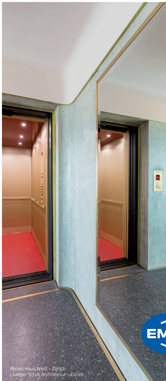
Hohes Haus West – Zürich Loeliger Strub Architektur – Zürich

Bauen Sie einen Lift, der so ist wie Sie – einzigartig.