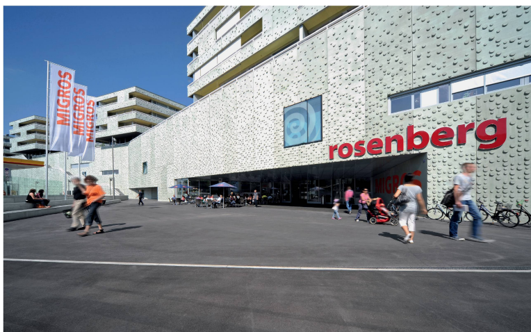
Der Wohn- und Einkaufskomplex Rosenberg in Winterthur ist mit einem SNBS-Pilotzertifikat ausgezeichnet worden (Architektur: atelier ww).

Grundlage für das neue Label sollen die Erfahrungen aus der Pilotphase bilden. Demnach sind sowohl der Ablauf des Zertifizierungsverfahrens als auch das Setting der Nachhaltigkeitskriterien zu optimieren. Bauherrschaften und Planer bemängeln den hohen Initialaufwand, teilweise nicht nachvollziehbare Gewichtungsfaktoren und die subjektive Einschätzung bei einzelnen Kriterien. Kritisch beurteilt wurden auch Bewertungsinhalte wie Mietermix versus Eigennutzung, urbane Standorte versus Biodiversität oder die starke Gewichtung des regionalökonomischen Effekts. Eine externe Evaluation der SNBS-Pilotphase ergab ausserdem, dass das Erbringen von Qualitätsnachweisen mit dem Zertifizierungsverfahren abzustimmen ist. Eine offene Frage sei ebenso, ob für öffentliche und private Bauten derselbe Nachhaltigkeitsmassstab gelten soll. • (pk)