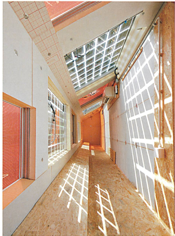
Der Prüfstand an der Supsi ist als Niedrigenergiehaus ausgeführt. Hier werden 22 verschiedene Module auf ihre Eignung als Baukomponenten geprüft.

Unter realistischen Bedingungen, also mit einer kompletten Konstruktion, kann solch ein Test Schwachstellen im Produktdesign, Wechselwirkungen zwischen den Modulen oder zwischen Modulen und Konstruktion offenbaren, die mit der Zeit zu Schäden führen können. Die Tests zeigen, wie wichtig es ist, die Systemperformance in einer Vorprüfung zu validieren, um die Installation und Langlebigkeit des Systems zu optimieren.