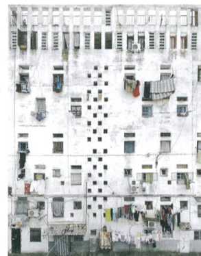
Fassade der Wohnanlage «climat de france» in Algier, errichtet vom Architekten Fernand Pouillon.

Die Veranstaltungen des SIA-Fachvereins Architektur&Kultur richten sich an Architekten und Kulturinteressierte, die ihr Wissen über Städte und Bauten vertiefen möchten. Unter sachkundiger Führung erleben Sie herausragende Beispiele zeitgenössischen Bauens oder tauchen ein in unbekannte Städte. Auch die schweizerische Baukultur steht mit einer Tagesexkursion zu Zürcher Genossenschaftsbauten wieder im Fokus. Im Folgenden finden Sie ausgewählte Veranstaltungen des aktuellen Programms. a&k-Mitgliedern gewährt der Fachverein bei vielen Angeboten Rabatt. (sia)