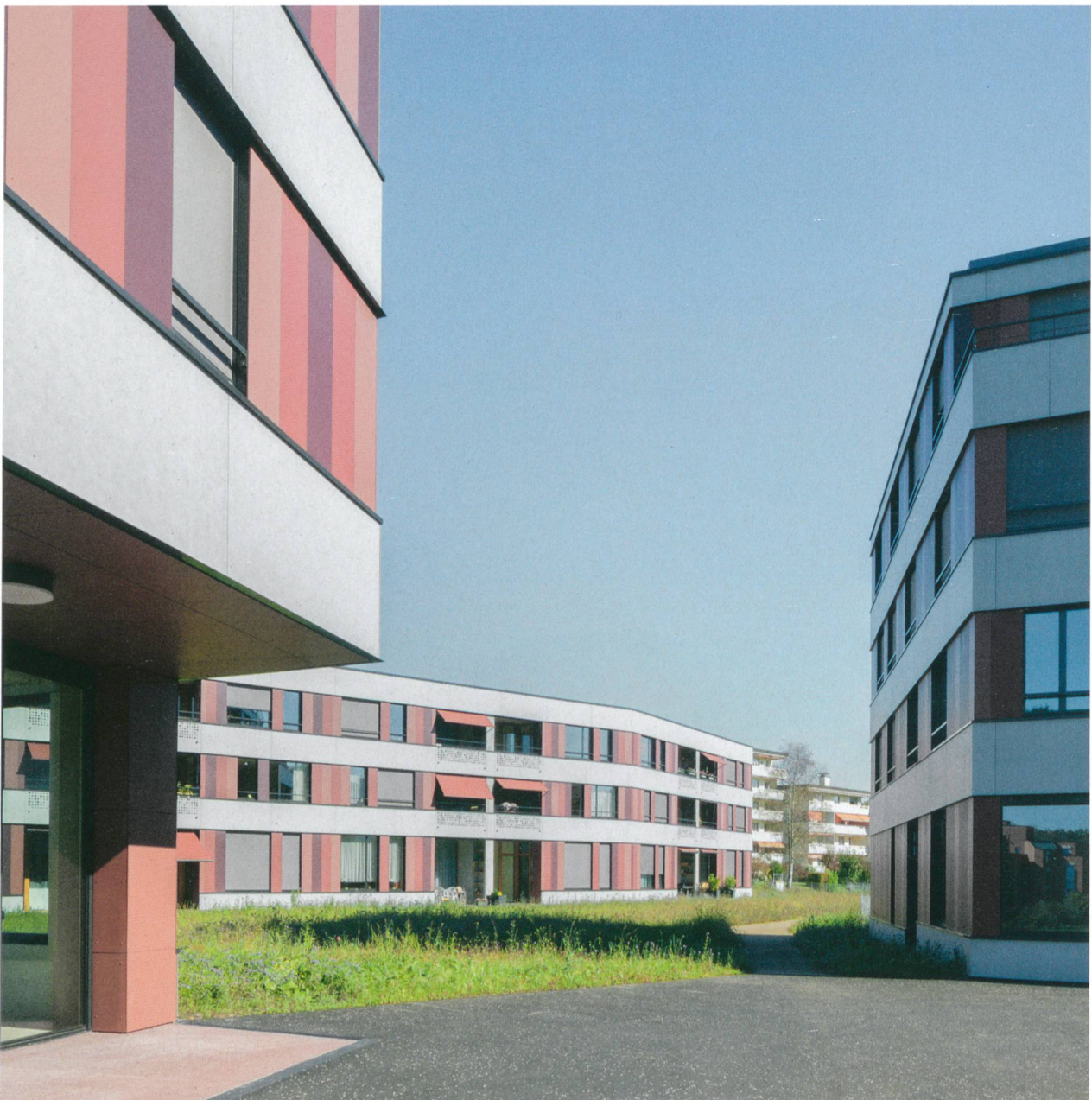
Alterswohnzentrum Köschentrüti: Beim ressourceneffizienten Bauen sind auch weniger kompakte Baukörper erlaubt; andere Faktoren wie Raumprogramm und Flächenbedarf bestimmen die Massenbilanz ebenfalls mit.