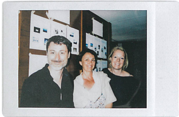
Die TEC21-Redaktion an Bord des Architekturschiffs.