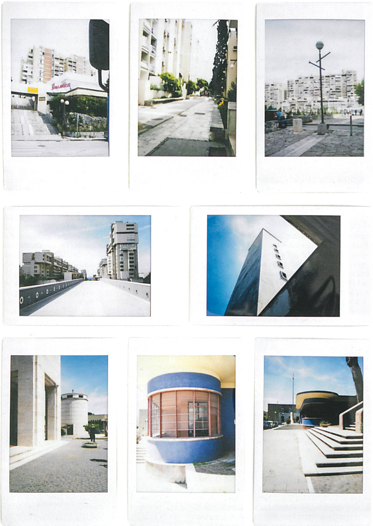
Eindrücke der Kreuzfahrtteilnehmerinnen und -teilnehmer aus der sozialistischen Stadterweiterung Split III (Reihe 1 und Reihe 2 Bild links; vgl. TEC21 24/2014) und aus Sabaudia, der faschistischen Stadtneugründung in den pontinischen Sümpfen.