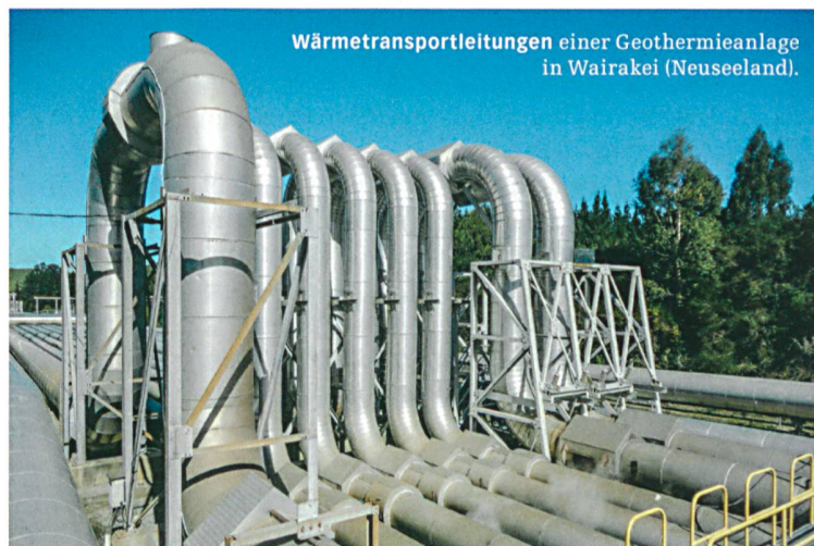
Wärmetransportleitungen einer Geothermieanlage in Wairakei (Neuseeland).