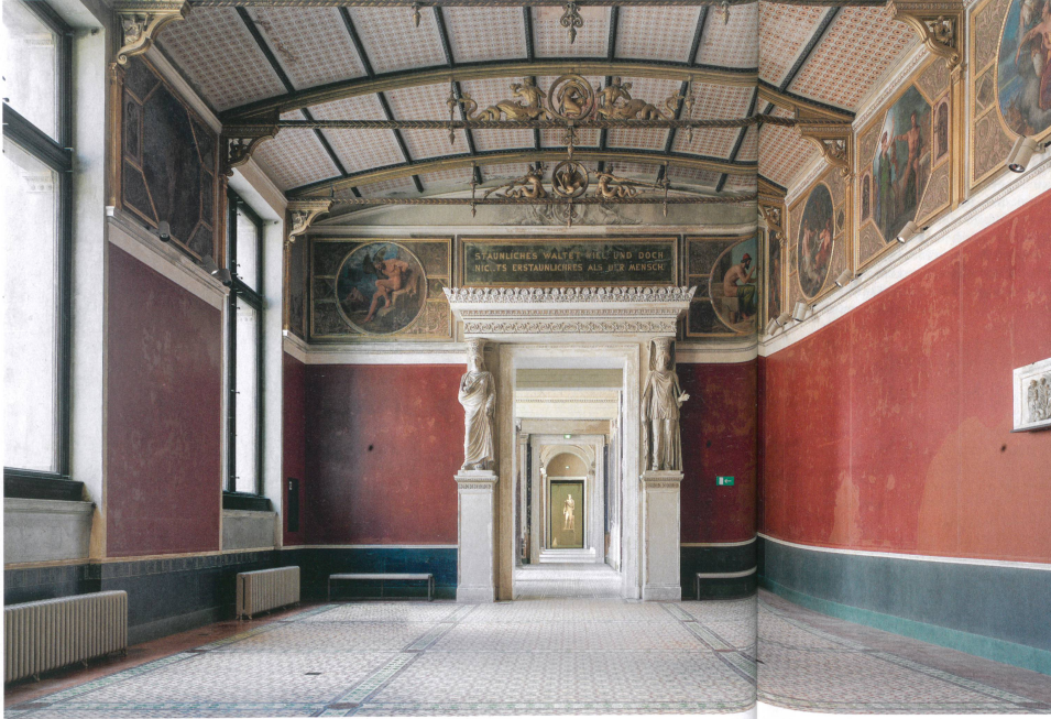
Niobidensaal des Neuen Museums Berlin. Ergänzende Wiederherstellung des Hauses: David Chipperfield Architects, London/Berlin; Ingenieurgruppe Bauen, Karlsruhe/Berlin (Tragwerksplanung); Lorenz&Co. Bauingenieure, Berlin (Begutachtung Eisenträgerwerk).