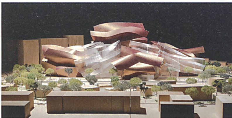
Finales Modell des Quanzhou Museum of Contemporary Art in Quanzhou (China).

In der Ausstellungspräsentation liegt der Schwerpunkt auf Modellen, wohl um die städtebauliche Auseinandersetzung des Architekten zu demonstrieren, die, wie in den Begleittexten behauptet wird, die wichtigste Inspirationsquelle für seine Gebäude sei. Dies lässt sich