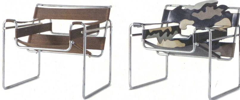
Alt und Neu werden einander gegenübergestellt: Marcel Breuer, Klubsessel B 3, 1925, bekannt als Wassily-Sessel, und Alessandro Mendini, Wassily-Sessel aus der Serie I, «Redesign di sedie del movimento moderno», 1983.

Der Blick auf Geschichte und Wirken des Bauhauses bis ins Heute wird geschärft durch das Gegenüberstellen historischer Exponate aus der Bauhaus-Ära mit Werken und Entwürfen heutiger Gestalter. Dazu kommen Interviews in Videoprojektionen und aktuelle Produkte, die direkt von Bauhaus-Gestaltungen