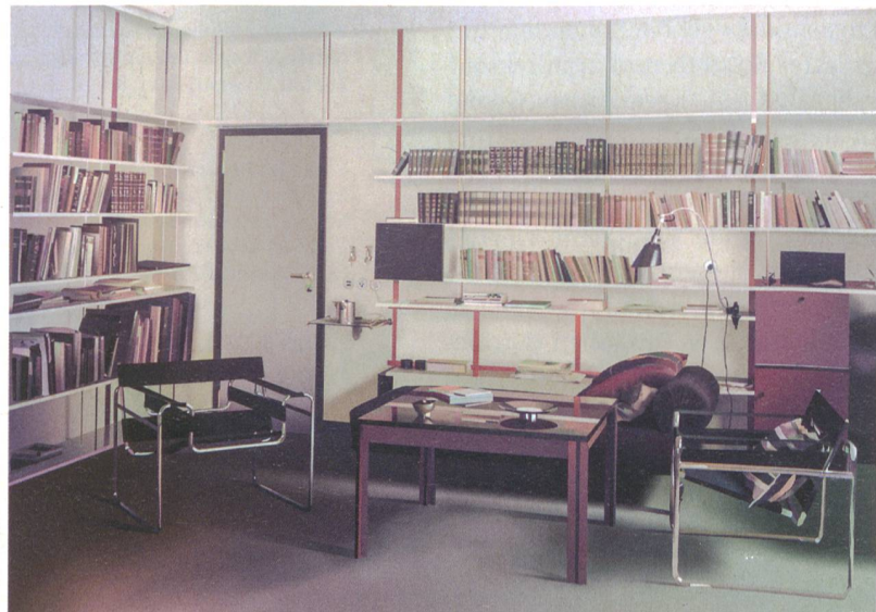
Adrian Sauer, «Raum für Alle», 2015.

Die Ausstellung ist in vier Themengruppen gegliedert. Den Beginn macht der Blick auf den historischen und sozialen Kontext, in einem zweiten Teil sind ikonische und auch