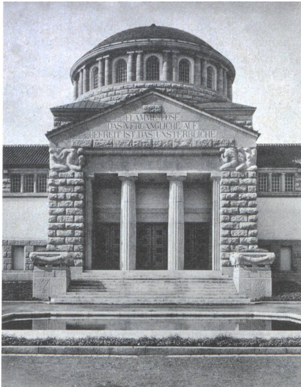
Ansicht des Haupteingangs des Krematoriums Sihlfeld von Architekt Albert Froelich (Brugg).