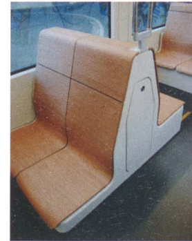
Die Sitzschalen bestehen aus Buche. Damit das Holz hygienisch, kratz- und rutschfest ist und auch länger schön bleibt, wird es mit einer schützenden Kunstharzschicht versehen. Die Dreierbestuhlung ergibt sich aus der in Basel üblichen Fahrzeugbreite von 2.30 m (Spurweite: 1000 mm).

ginnen. Dies ist bei der Gestaltung des eigentlichen Halteteils und des Befestigungsteils zu berücksichtigen. Weitere Kriterien sind Material und Farbe. Für Haltestangen sind nach geltenden Vorschriften mit dem Hintergrund kontrastierende Farben zulässig, oft gelb oder rot. Auch Edelstahl Ausführungen sind möglich. Knackpunkt dabei ist der richtige Schliff der Oberfläche, damit die Stange auch für sehgeschwache Passagiere erkennbar bleibt. Denn je nach Schliff ergeben sich ungleichmäßige Spiegelungen oder gleichmäßige Schattenwürfe.