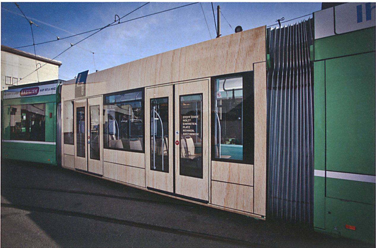
Sitztest Tram: Bei der Umfrage im März 2012 entschieden sich 58.5% der teilnehmenden Fahrgäste für Holzsitze (2102 Stimmen), 27.5% stimmten für Stoff (989 Stimmen), für 14% spielte der künftige Bezug keine Rolle, bzw. sie konnten sich nicht entscheiden (502 Stimmen).

Das Bundesamt für Verkehr (BAV), das für die Zulassung der Fahrzeuge auf Bundesebene zuständig ist, wird früh in den Prozess eingebunden. Bereits das Pflichtenheft und die Typenskizze werden dem BAV vorgelegt. Es erhält umfangreiche, zur Genehmigung nötige Unterlagen und Nachweise. Bevor das erste Tram