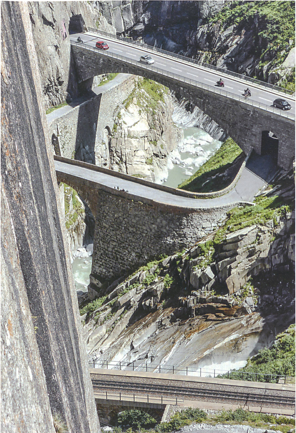
Die Bilder auf den folgenden Seiten zeigen die unkommentierte Sicht von Fotografin Thea Altherr auf die (Verkehrs-)Landschaft am Gotthardmassiv.