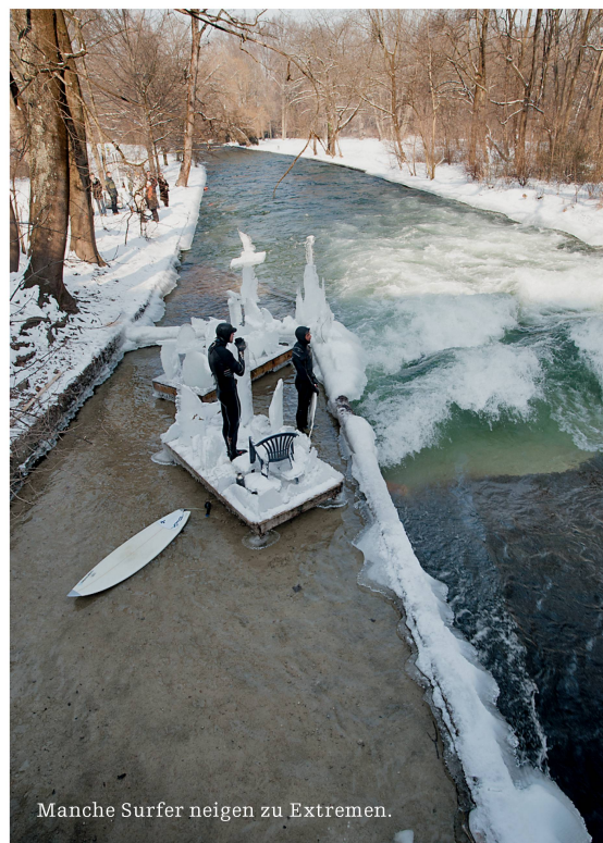
Manche Surfer neigen zu Extremen.

Eine Welle im Hauptschluss eines Flusses oder durch Einbauten am Ufer zu generieren ist schwierig, da eine Regulierung fast unmöglich ist. Hydraulisch einfacher, aber baulich aufwendiger ist es, einen Teil des Wassers in ein Nebengerinne auszuleiten. Damit ist es von den Zuflussbedingungen entkoppelt. Können Zufluss- und Abflussbedingungen im Seitengerinne fixiert werden, genügt im Prinzip schon ein Absturz, den die Hydrauliker so berechnen können, dass der Wechselsprung nicht wegwandert.