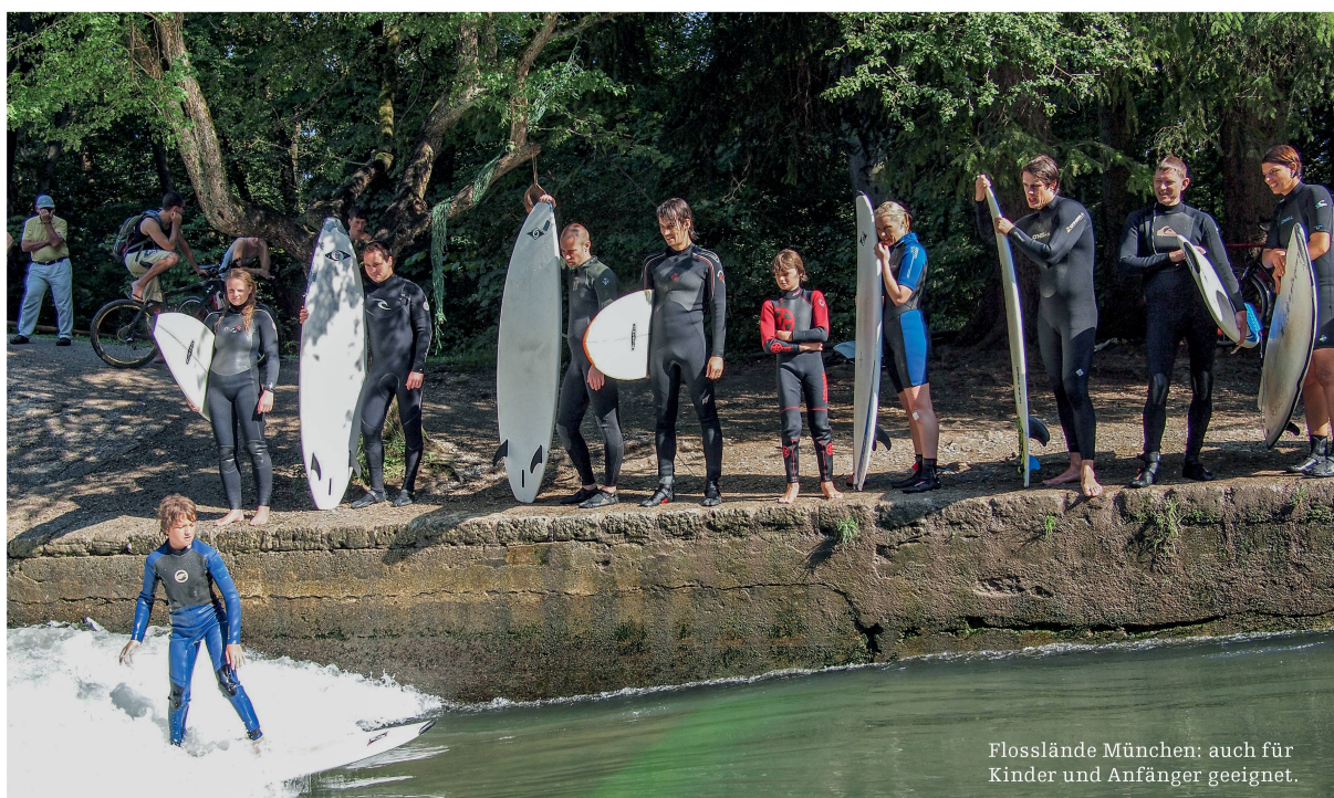
Flosslande München: auch für Kinder und Anfänger geeignet.

Wasser zu nutzen war schon immer ein menschliches Interesse. Die nötigen Infrastrukturen dafür herzustellen ist eine klassische Fachdisziplin der Bauingenieure. Relativ neu ist die Frage, wie eine surfbare Welle für Wassersportler aussieht. Die Antwort klingt einfach: Die perfekte Welle läuft 24/7, ist leicht zugänglich, sicher, möglichst steil und hoch und vor allem breit. Im Gegensatz zu gängigen Ingenieurdisziplinen findet man in der Literatur hierzu noch keine Bemessungsgrundlagen. Es gibt lediglich einige Anhaltspunkte – die aber nicht unbedingt erfolgversprechend sein müssen, da die Natur weitgehend unberechenbar bleibt.