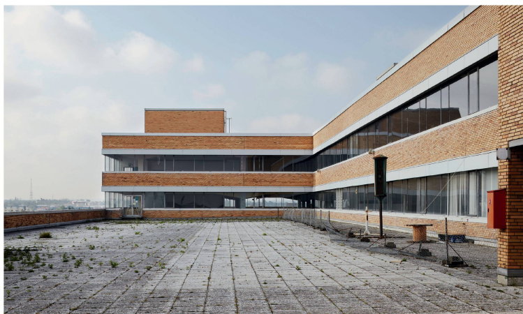
Die Dachterrasse des stillgelegten Quelle-Grossversandzentrums in Nürnberg von Ernst Neufert.