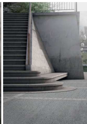
Visualisierungen: Enzo Valerio

per la Svizzera italiana, francese e tedesca (membri del comitato A&C). Ad ogni riunione della giuria partecipano un rappresentante del Gruppo professionale Architettura SIA e un rappresentante della Sezione SIA locale (Ticino, Vaud e Zurigo). La composizione e la continuità della giuria rendono possibile una visione globale di tutti i progetti di master consegnati nelle tre scuole superiori, considerando nel contempo i diversi approcci. Presso l'ETH di Zurigo sono assegnati ogni semestre tre temi a scelta. All'EPF di Losanna i temi e il programma sono sviluppati autonomamente dagli studenti. All'Accademia di architettura di Mendrisio si elabora in gruppo un argomento che poi verrà approfondito individualmente.