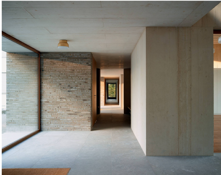
Das Zusammenspiel von Raum und Material prägt das Schulhaus in Mülligen . Gegen aussen zurückhaltend, zeigt das Haus im Inneren ein reiches Leben.

Das lang gestreckte Gebäude teilt sich in einen flacheren Teil, der dem neuen Platz zugewandt ist und die Eingänge mit den Garderoben beherbergt, und in einen höheren Teil, in dem sich vier Klassen- und drei Gruppenräume befinden.