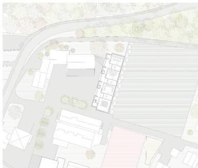
Das neue Schulhaus fasst die öffentlichen Gebäude zu einem kleinen Platz. Situation im Mst. 1:3000.

Seit den 1980er-Jahren hat sich die Bevölkerung von Mülligen mehr als verdoppelt, und mit dem Wachstum kam das Bedürfnis nach einem neuen Primarschulhaus – zudem hat der Kanton die Primarschule von fünf auf sechs Jahre ausgedehnt. In einem Wettbewerb konnten sich 2013 die Architekten Christian Bühlmann und Franco Pajarola mit ihrem Projekt durchsetzen. Das neue Schulhaus ergänzt das kleine Ensemble aus Gemeindehaus, Mehrzwecksaal und der alten Schule aus den 1960er-Jahren und trennt es vom Sportplatz ab.