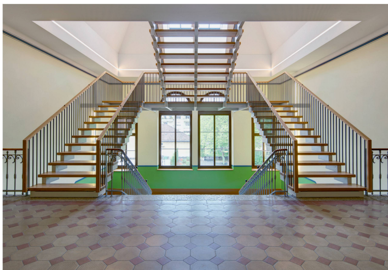
Grosses Länggassschulhaus in Bern: Übergang vom bestehenden Treppenhaus in die neu konstruierte Treppenanlage zum ausgebauten Dachgeschoss.

zum Opfer. Von aussen zeugt heute daher nur der neue Unterstand auf dem Pausenhof von der Bautätigkeit. Wie ein abstrahierter Blätterwald bietet das Betondach Schülern und Velos an der Geländestufe zum Hof Schutz vor Niederschlag.