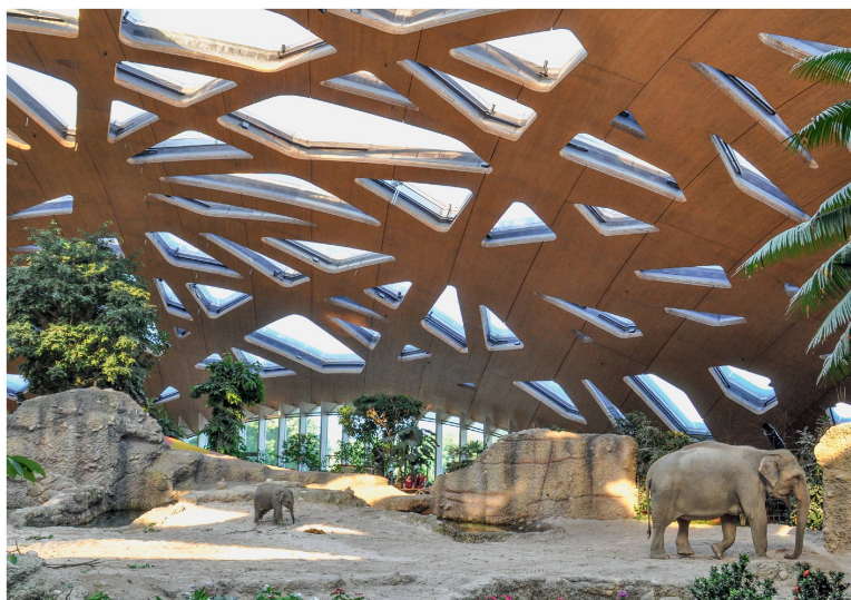
1. Preis: Kaeng Krachan Elefantenpark. Der Preisträger gilt als innovativ, interdisziplinär, schön und nachhaltig – und wurde vom Fachgremium einstimmig gewählt.

Besonders innovativ bei dieser 80 m weit gespannten Kuppel sei die Kombination des Spannbetonrings mit den vernagelten Brettsperrholzplatten. Die statisch optimierte