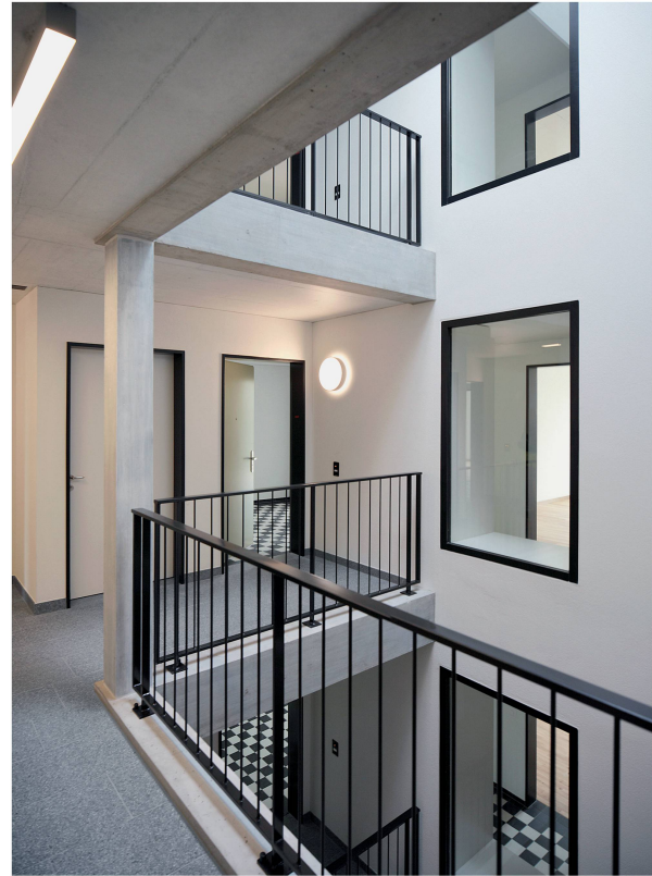
Die innere Erschliessung mit Ein- und Ausblicken für ein gemeinschaftliches Miteinander (Haus B).