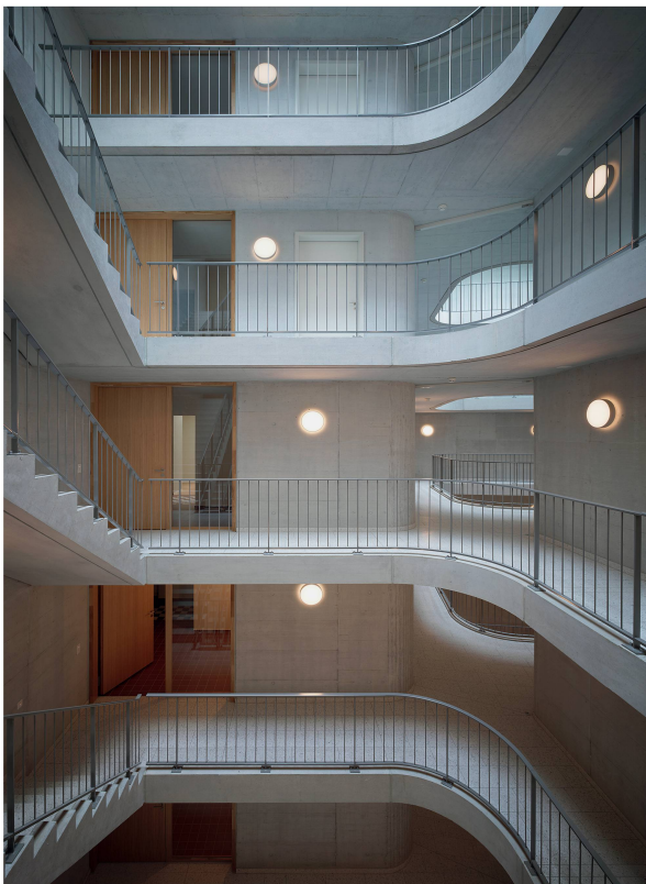
Grosszügige, offene Treppenhäuser als Antwort auf die tiefen Gebäudevolumen (Haus K).