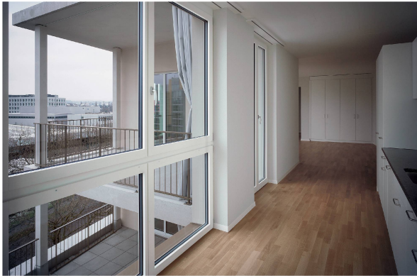
Unterschiedliche Grundrisse mit (fast) einheitlicher Ausstattung (oben: Haus B; unten: Haus K).