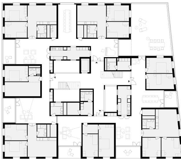
Oben: zwei Satellitenwohnungen im 1. Obergeschoss von Haus I. Grundriss im Mst. 1:400.