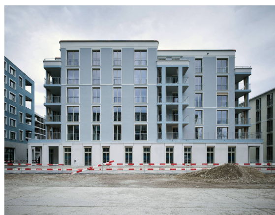
Villenartige Stadthäuser als tragende Elemente für die überbordende Quartiermorphologie (oben: Haus K; unten: Haus C).

Architekturküche stammen. Zu loben ist die Absenz einer in vielen Neubauquartieren grassierenden Beliebigkeit sowie einer autistischen Architektur. Trotzdem hätte ein «Weniger ist mehr» dem Hunziker-Areal urbaneren Charakter verliehen und wäre der selbst formulierten Analogie zum Idaplatz gerechter geworden.