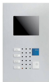
VTC40 / Alu