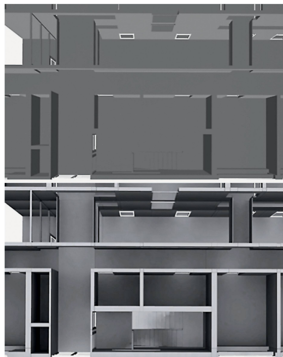
Unbeleuchtete Geometrie ist schwer zu erkennen (oben). Mit vorberechneter Beleuchtung kann eine komplexe, globale Lichtausbreitung in Echtzeit angezeigt werden (unten).

Materialien werden in Game-Engines auch für animierte Oberflächen verwendet. Eine Wasseroberfläche zum Beispiel kann mit einem Shader-Programm bewegt werden und sieht damit fast fotorealistisch aus. Und auch die Grashalme, die sich im Wind bewegen,