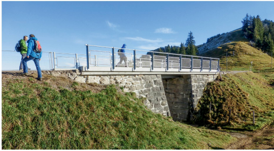
Die Brücke Schild besteht aus tragenden Betonplatten, die auf historischen genieteten Eisenträgern aufliegen.

der Firstverbau mittelfristig instabil geworden wäre. Stahlstützen, Drainagen, Netze und Spritzbeton stützen das Gewölbe heute zusätzlich.