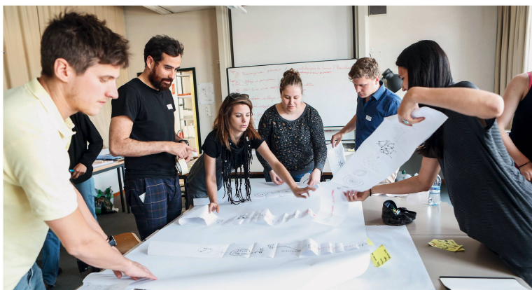
Die Studierenden während der Workshop-Diskussion in Genf.

Die sprach- und hochschulübergreifenden Gruppen schienen zunächst umständlich, brachten im Lauf des Workshops aber genau jenen intensiven Austausch, aus dem am Ende kreative Utopien und Visionen entstehen. Jede Arbeitsgruppe hatte an dem Workshop eine spezifische Fragestellung zu bearbeiten und wurde dabei von Vertretern von SIA und ARE begleitet: Was heisst «100% Schweiz»? Was sind unsere