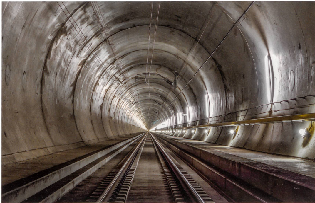
Der Gotthard-Basistunnel ist Thema der Eröffnungsveranstaltung des Swissbau Focus am 12. Januar 2016.

D er diesjährige Swissbau Focus beschäftigt sich mit dem Thema «Rettung durch Technik?». In rund 60 Podiumsdiskussionen, Workshops und geführten iTours soll geklärt werden, inwiefern moderne Technik unsere Rettung ist oder ob wir uns vor ihr retten müssen.