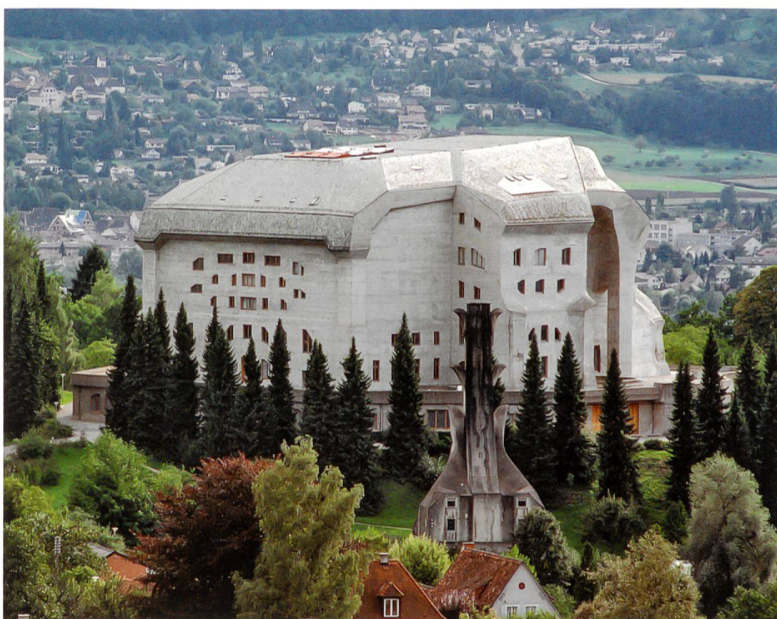
Eine ewige Baustelle: die Instandhaltung der Betonfassade des Goetheanums.