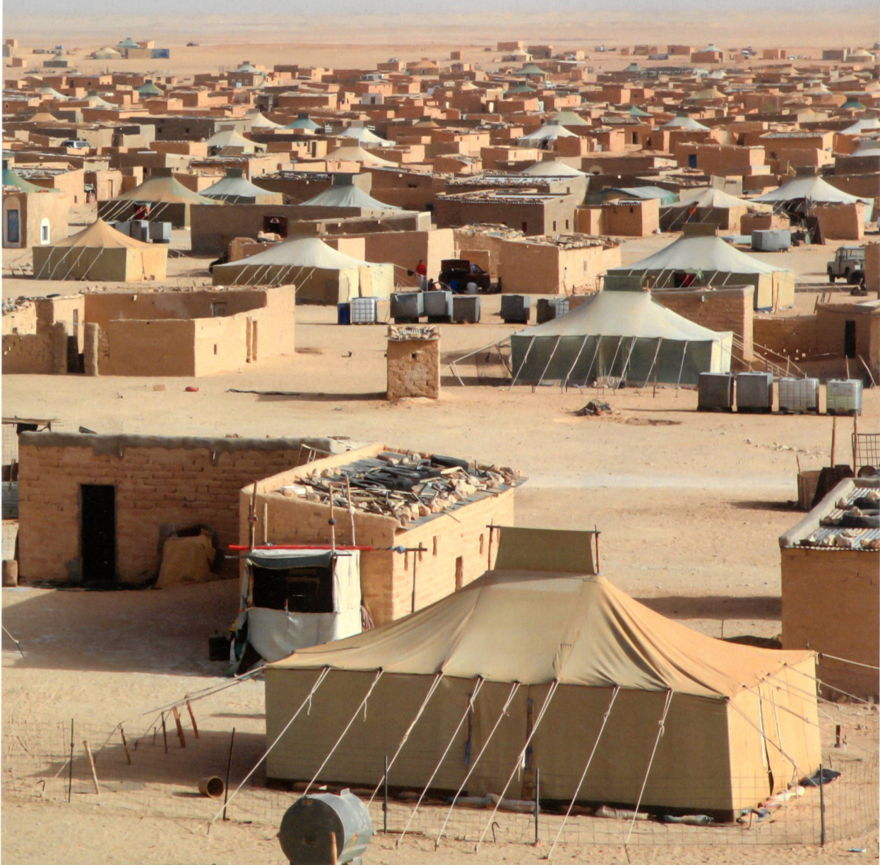
Das Lager Smara: Die Zelte bleiben stehen, sie sollen trotz massiver Bauten daran erinnern, dass die Stadt ein Flüchtlingslager ist – und keine bleibende Heimat.