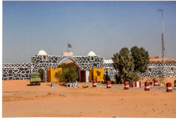
Ganz oben: Das Verteidigungsministerium ist einer unter verschiedenen Ministeriumsbauten in Rabouni.

Die Saharais haben ihr eigenes Schulsystem entwickelt, das eine allgemeine Schulbildung für alle Kinder und Jugendlichen garantiert und zu einer der niedrigsten Analphabetenraten des Maghreb geführt hat. Für ihr eigenverantwortlich aufgebautes Gesundheitssystem wurden Krankenpfleger und Ärzte in Spanien und Kuba ausgebildet. Das ermöglicht eine Lebenserwartung, die hinter den angrenzenden Staaten nicht zurücksteht. Auch wenn die Lager mit ihren Lehmbauten und Zelten sich auf den ersten Blick nur wenig von