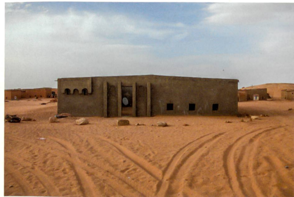
Oben: Dieses Lehmhaus im Lager Aioun ist mit Zement verputzt. Es wurde in drei Monaten erstellt.

anderen unterscheiden, sind sie einzigartig in der Form, wie Flüchtlinge – im Exil innerhalb einer Ausnahmesituation – ein relativ eigenbestimmtes Leben führen. Auf wirtschaftlicher Ebene und hinsichtlich Ernährung stößt diese Autonomie jedoch an Grenzen. In der unwirtlichen Wüste wächst kaum etwas, sodass die Flüchtlinge auf Lebensmittellieferungen und Spenden angewiesen sind. Dennoch sind die Lager vom Grundgedanken geleitet, vom allerersten Tag eine Qualität der Normalität, Beständigkeit und Emanzipation zu entwickeln. Dies immer mit dem Gedanken, alles wieder verlassen zu können, falls sich die Möglichkeit einer Rückkehr bieten sollte. Die Zeit in den Lagern wird auch als Zeit des Lernens betrachtet, in der sich die Flüchtlinge auf die Rückkehr in die Heimat vorbereiten.