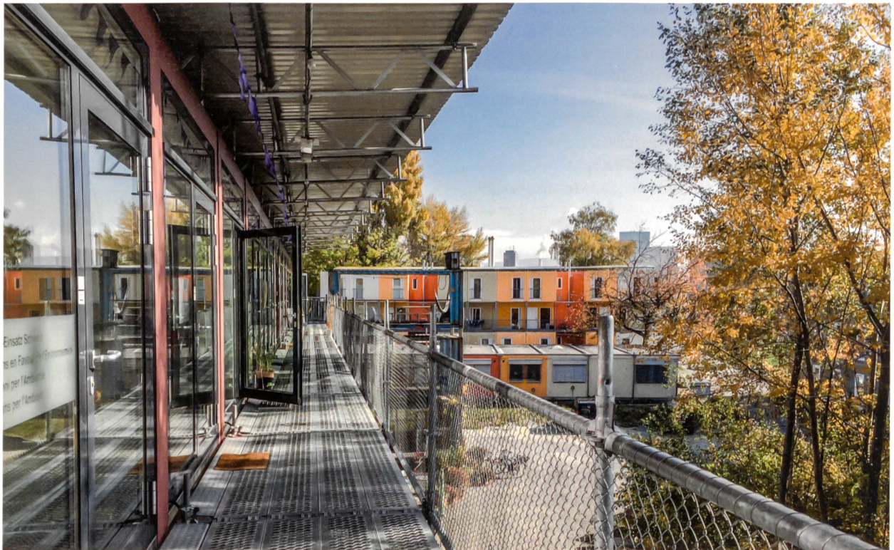
Laubengang der Ateliercontainer des Basislagers mit Blick auf die Asylunterkünfte.

Ungerüstete Zivilschutzanlagen im Untergrund, Hüttendörfer in Hallen, Militärzelte auf Kasernenplätzen oder leer stehende Kommunalbauten an gesichtslosen Einfahrtsstrassen sind Orte, an denen Asylsuchende in der Schweiz untergebracht werden. Diese Unterkünfte sollen nur einen zeitlichen Aufschub bieten, bis passende Lösungen gefunden sind. In Wirklichkeit jedoch bleiben viele Asylsuchende länger als geplant darin.