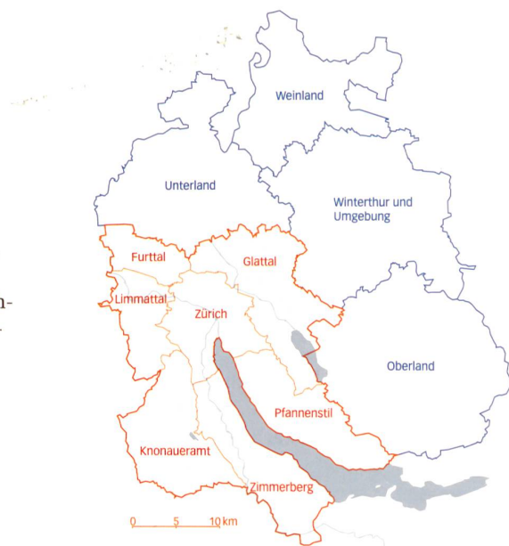
Das Gebiet der RZU im Kern des Zürcher Metropolitanraums (Darstellung mit Kantonsgrenzen).

Es war ganz wesentlich eine inhaltliche Motivation, die mich zum Wechsel bewogen hat. Über die letzten Jahre haben mich immer mehr Fragen der