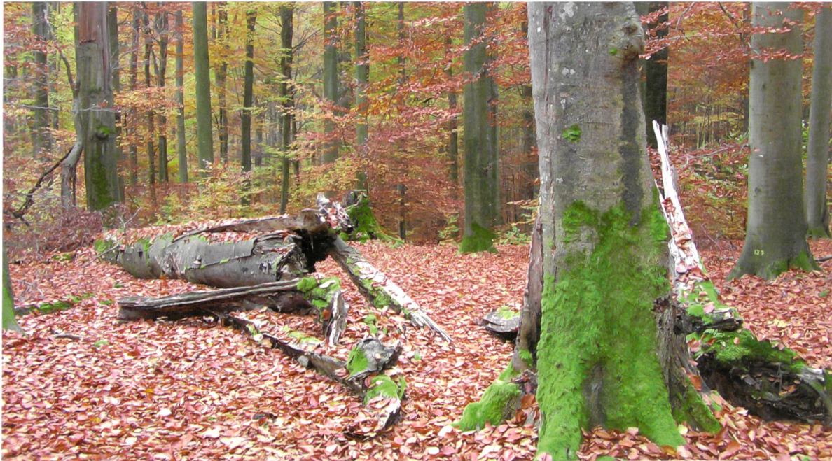
Xylobionte Arten nutzen das stehende und liegende Totholz als Lebensraum oder Nahrungsquelle. Rund ein Fünftel der Waldtiere, über 2500 Pilzarten, Pflanzen, Flechten, Bakterien und Algen sind direkt oder indirekt auf Totholz angewiesen.