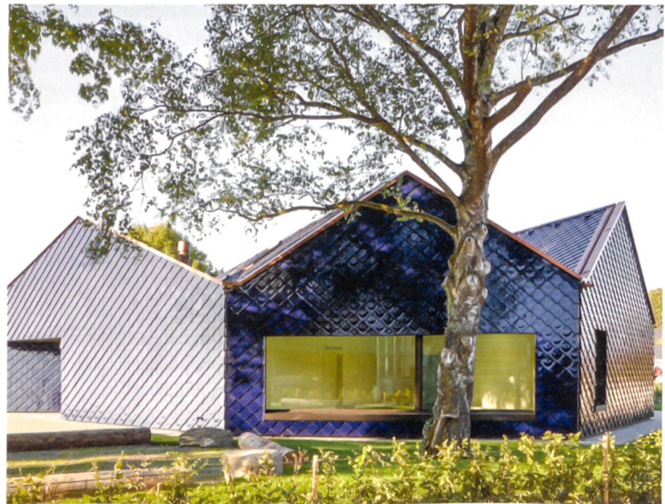
Schimmernder Solitär: Doppelkindergarten Zelgli in Kleinandelfingen ZH.

Die Sektion Winterthur des SIA hatte mit einem Rahmenprogramm und einem für den Projektumfang aufwendig gestalteten Falblatt mit Lageplan und Projektsteckbriefen alles getan, um den SIA-Tagen grösstmögliche öffentliche Aufmerksamkeit zu verschaffen. Zu die-