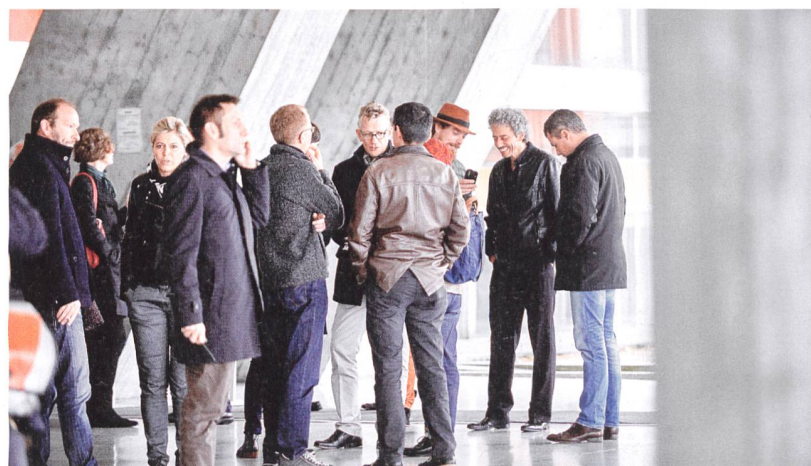
Die Konferenz der SIA-Berufsgruppen und -Sektionen fand im Kongresshaus Biel statt.

Tatsächlich wird man den Eindruck nicht los, dass die von den Städten vielerorts angegangene Verdichtung zu legitimieren versucht wird, indem man gleichzeitig immer noch mehr Plätze und Pärke baut. Schläppi findet, in der Menge schies-