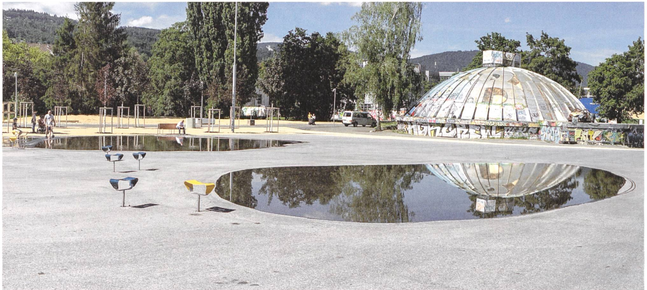
Die grosse Esplanade vor dem Kongresshaus, gestaltet von raderschallpartner ag landschaftsarchitekten, ist ein Beispiel aktueller Freiraumgestaltung in der Stadt Biel.

se man heute häufig über das Ziel hinaus. Zudem würden die Plätze auch mit immer noch mehr Attraktionen, Begegnungs- und Vergnügungsmobiliar «aufgerüstet». Dieser Überfrachtung steht er kritisch gegenüber. Ist öffentlicher Raum seiner Ansicht nach doch ganz einfach die Beziehung zwischen dem Menschen und dem Ort. In Konsequenz würde er sich, wie er es nannte, einen demütigeren und auch einfacheren Umgang mit unseren Plätzen wünschen – z. B. indem die bestehenden öffentlichen Räume im wahrsten Sinn des Wortes einfach aufgeräumt würden.