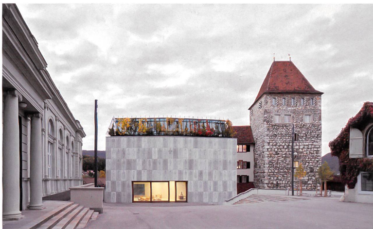
Altes, neues Museum: In der verglasten, begrünten Attika liegen die Büros.

Der im April 2015 eingeweihte Neubau erstreckt sich über vier Geschosse (UG: Foto- und Filmraum; EG: Foyer; OG: Ausstellungssaal; DG: Verwaltung). Die Raumhöhe einer Ebene entspricht jeweils derjenigen von zwei Etagen im West-