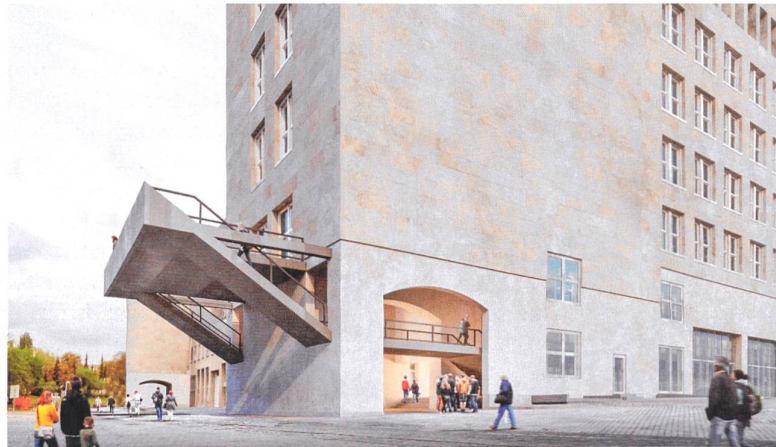
Siegerentwurf von :mlzd: Die Stahlterrasse vom EG ins 1. OG missfiel zwar der Jury, setzt aber ein starkes Zeichen.

Auf dem Dach des Kopfbaus West ist eine Aussichtsterrasse geplant. Dabei soll der ehemalige Tower zugänglich gemacht werden. Die Terrasse und ihre Erschliessung sind der Auftakt für eine 1.3 km lange Geschichtsgalerie, die Besucher