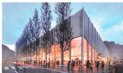
Beleuchtete Tribünenuntersicht, die Halle soll zur Landmarke werden.

A ktuell trägt der Heimverein mit dem Löwen im Vereinswappen seine Spiele der Nationalliga B in der Litterna-Halle von 1979 aus. Der Bau ist in die Jahre gekommen, zwei Machbarkeitsstudien empfahlen statt einer Sanierung einen Neubau für maximal 5000 Zuschauer im Osten der Stadt.