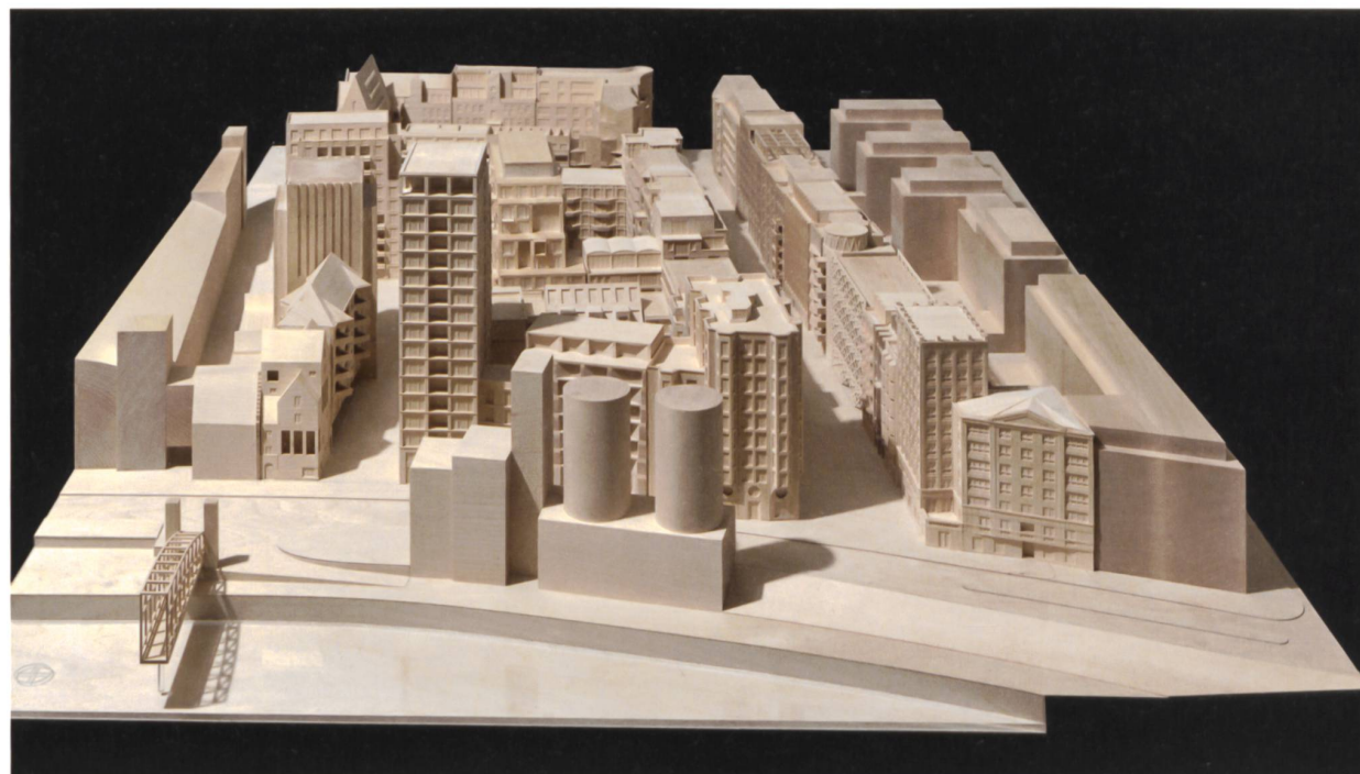
Blick vom Spreeufer nach Norden in das Quartier der WerkBundStadt: städtebauliches Modell im Massstab 1:200 mit den ausgewählten Gebäudeentwürfen der 33 beteiligten Architekturbüros.

Ingemar Vollenweider: Es geht hier nicht zuerst um Wohnungsbau, sondern um Stadtbau. Das bisherige Projekt ist folglich nicht das Ergebnis eines Wohnbauexperiments, wie es von Teilen der Presse reflexartig vermisst und entsprechend kritisch diskutiert wurde. Vielleicht rührt dieses Missverständnis daher, dass wir nicht nur in der Schweiz, sondern auch in Deutschland zuerst Wohnungs- und Siedlungsbau machen und das dann mit Stadtbau gleichsetzen. Im Zweifelsfall setzt sich auch in Wettbewerben nicht der konsequente Städtebau, sondern der coole oder auch nur wirtschaftliche Wohnungsgrundriss durch. Hinter dem Entwurf zur WerkBundStadt steht eine andere Überzeugung: Er möchte öffentliche Räume schaffen, die Identität und Kollektivität ermöglichen, und thematisiert damit die Frage,