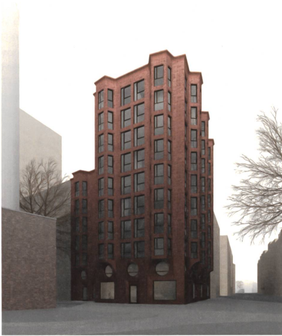
Gebäudeentwurf von jessenvollenweider für einen Stadtbaustein der WerkBundStadt, Strassenraumperspektive.

die Bedürfnisse an einem spezifischen Ort zu treffen. Das kooperative Verfahren bei der WerkBundStadt verhandelt eine grössere Vielfalt, ist weniger prägnant, dafür elastischer. Damit sind wir wieder beim Prozess: Er lässt tatsächlich Schlaufen zu – und ist damit natürlich sehr zeitaufwendig.