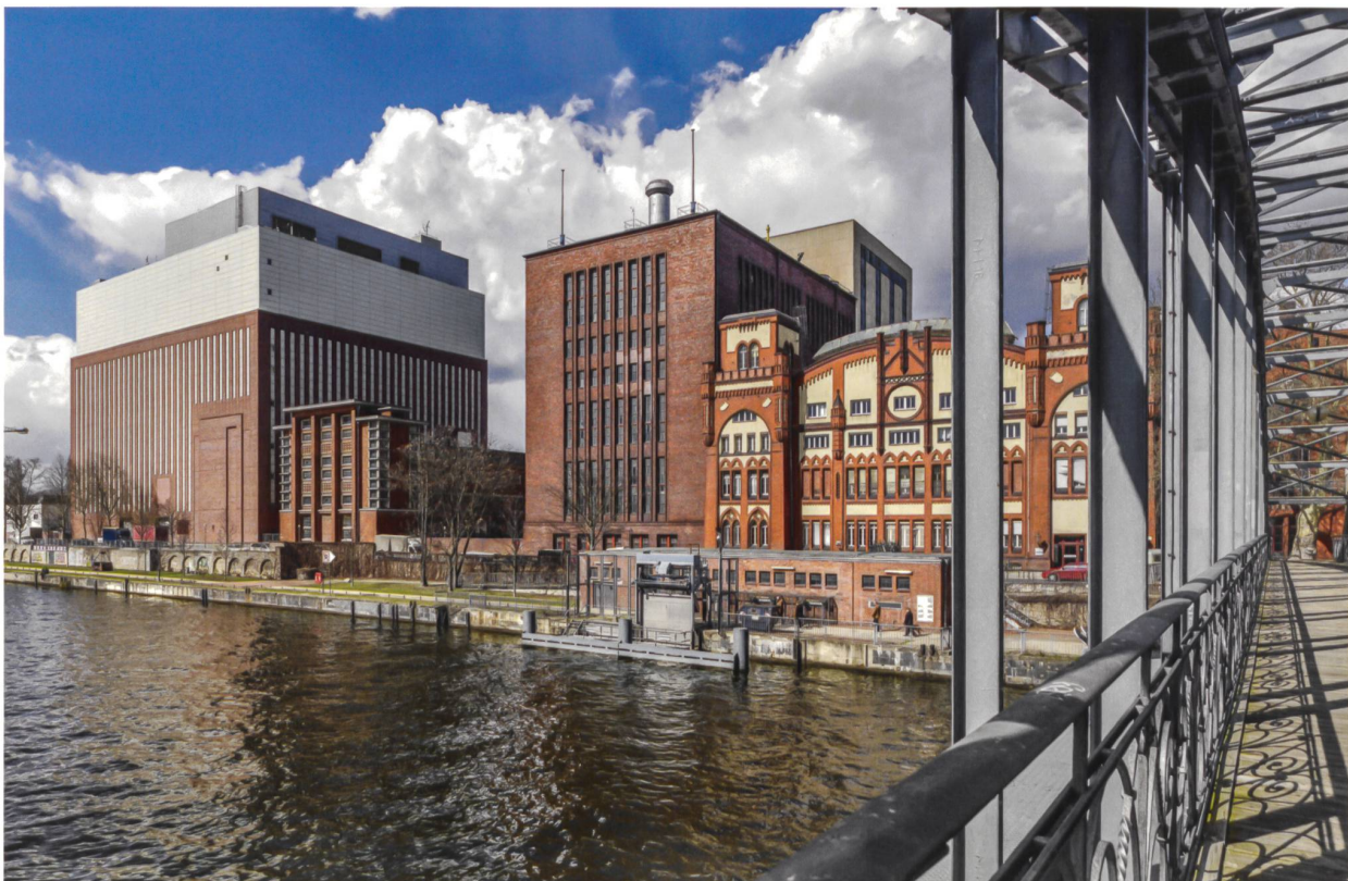
Die WerkBundStadt entsteht in einem industriell geprägten Kontext: Der westliche Nachbar ist das Heizkraftwerk Charlottenburg.

Jessen: Man muss unterscheiden zwischen der formellen Frage des Wettbewerbs und der Frage: Wie komme ich zu einem glaubwürdigen Stück Stadt, das sich immer auch aus dem Zueinander von ganz unterschiedlichen Teilen definiert? Der Werkbund Berlin hat eine Auswahl von einzelnen Architekten und damit auch Positionen bestimmt und aufgrund der Klausuren und des gemeinsam definierten Städtebaus eine Basis geschaffen, auf der man nach einer Einheit suchen kann. Die beteiligten Architekten haben gemeinsam um jene Basis gerungen, also gewissermassen die Auslobung und das Programm mitgeschrieben, und tragen entsprechend diese Verantwortung mit. Bei einem städtebaulichen Wettbewerb gibt es dagegen «phasengerecht» eine klare Schnittstelle zwischen der Definition der Aufgabe und dem Entwurf eines Projekts. Bei einem Areal von vergleichbarer Grösse würde das siegreiche Projekt in der Umsetzungsphase wahrscheinlich unter den Preisträgern aufgeteilt, um die Einheit architektonisch zu differenzieren. Persönlich finde ich es heute sehr viel interessanter, unterschiedliche Positionen