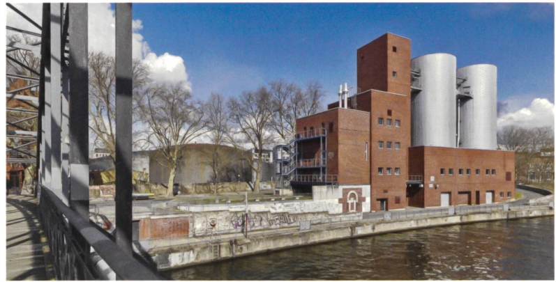
Blick vom Siemenssteg auf das Grundstück der WerkBundStadt