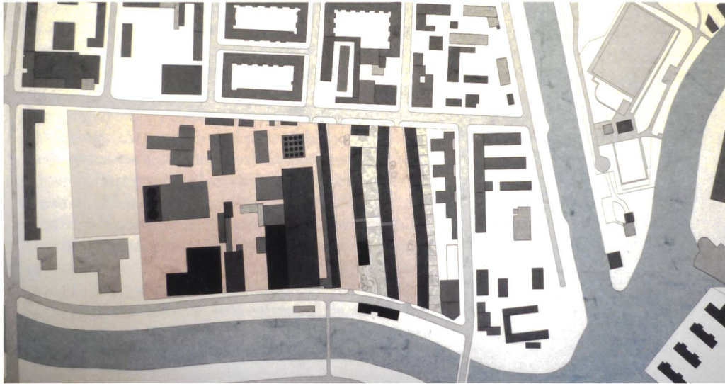
Städtebaulicher Entwurf des Teams Caruso St John, London/Zürich, und Jessenvollenweider, Basel, als Vorschlag für die WerkBund-Stadt in Berlin.

in einen Prozess auf der Suche nach Einheit zu involvieren, als umgekehrt Einheit im Nachgang und nur mit der Spekulation auf die sogenannte individuelle Handschrift heterogener zu machen.