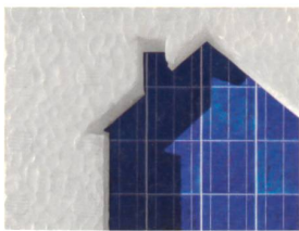
Ja, so stellt man sich Selbstversorger vor: eingepackt in Styropor, blau glänzende Photovoltaik, so weit das Auge reicht. Energieplaner haben aber mehr zu bieten als das – und Architekten im Idealfall auch.