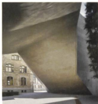
Der «Torbogen» im Neubau des Landesmuseums Zürich dient als Durchgang vom Hof in den Park. Zugleich fungiert er im Innern als Brücke mit monumentaler Kaskadentreppe. Statisch funktioniert die Brücke als Dreibein.