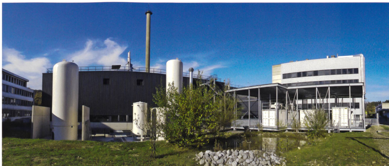
Die Power-to-Gas-Versuchsanlage am Paul-Scherrer-Institut ist Bestandteil einer Energiesystem-Integrationsplattform. Im Vordergrund steht das Erforschen von Speichervarianten und der energetischen Nutzung von Biomasse.