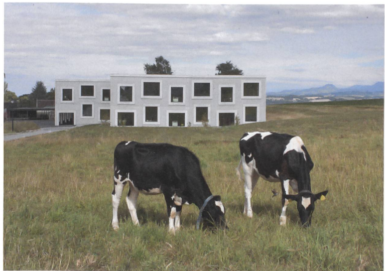
Umgeben von Weiden: der Neubau der Primarschule in Avry FR. Grosse Fenster holen die Landschaft und den weiten Himmel ins Innere.