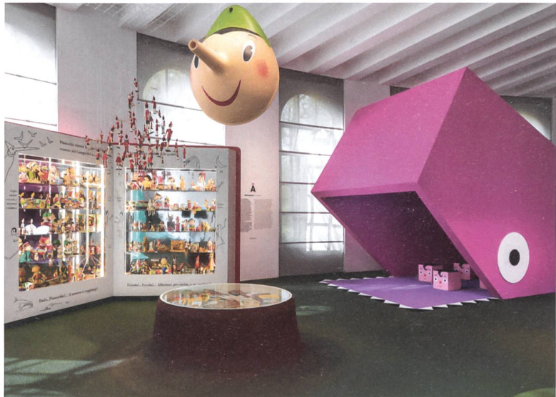
Eine als Buch gestaltete Vitrine quillt von Pinocchios förmlich über.

«Giro Giro Tondo» entspricht übrigens deutsch dem Kinderlied «Ringel Ringel Reihen». Das Lied kennen die Italiener aus ihrer Kindheit: «Giro giro tondo/Casca il mondo/Casca